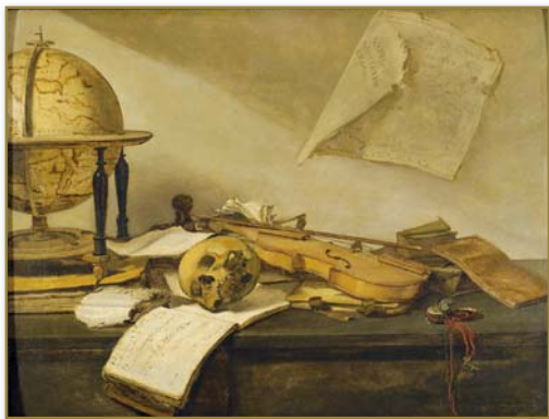
Jan Davidz de Heem, Vanité, inv.1907.1.125

Le triomphe de la mort, un genre revisité du XIXe à l'art contemporain