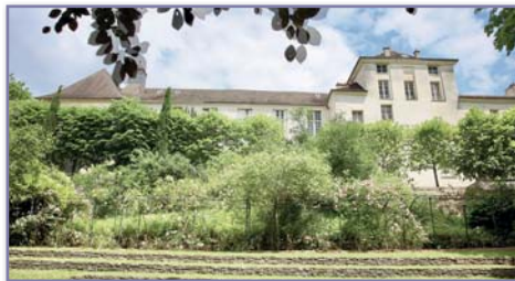
Musée Maurice Denis Saint Germain en Laye

Musée de L'horlogerie à Saint-Nicolas-d'Aliermont et Arques-la-Bataille