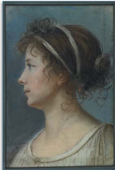
Autoportrait d'Elisabeth Vigée Le Brun inv. AG.2011.0.463