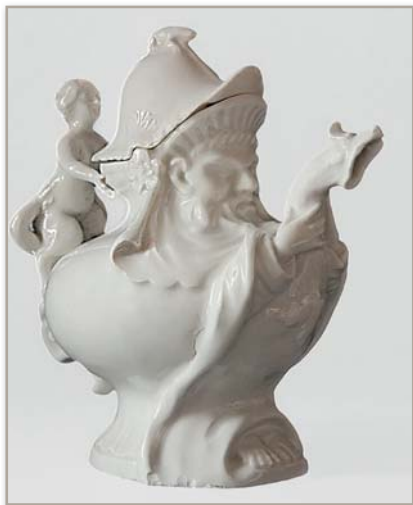
Théière vers 1720, Meissen.