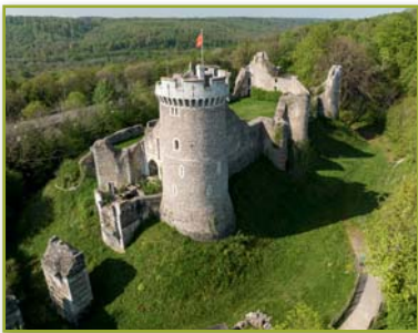
Le château de Robert le Diable