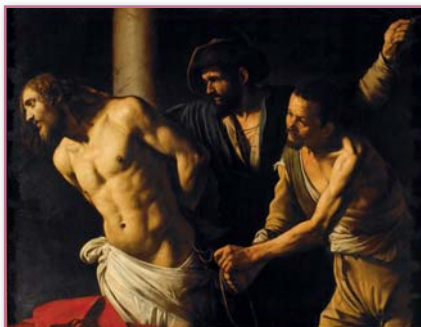
Le Caravage, La Flagellation du Christ à la Colonne, inv. 1955.8.1

Le Corps, dans le cadre du Temps des Collections