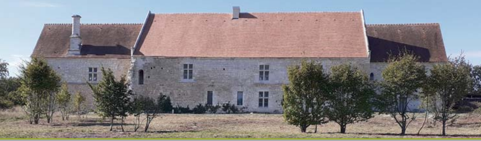
le manoir d'Agnès Sorel © Marc Laurent

Elles se tiennent le vendredi à 14h30 , à l'auditorium du musée des Beaux-Arts de Rouen, 26 bis rue Jean Lecanuet.