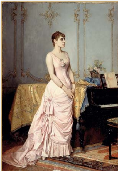
Auguste Toulmouche, portrait de Rose Caron, vers 1880

La dimension spirituelle de l'expérience musicale