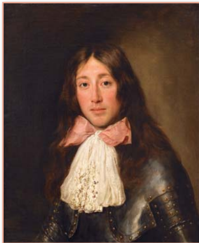
Jacob Ferdinand Voet, portrait d'officier au nœud rose, inv. 1975.4.59

Auditorium du musée des Beaux-Arts, 26 bis rue Jean Lecanuet à Rouen à 17h30 .