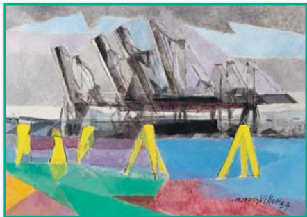
Jacques Villon (pseudonyme de Gaston Duchamp 1875-1963) Le Port de Rouen (ou la Seine au Val de la Haye), 1959 Don des AMAR