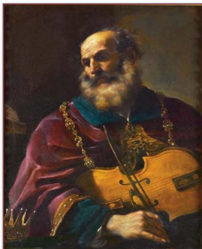
Le Guerchin, le roi David, inv. 1975.4.90