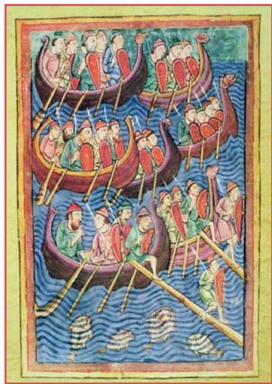
Débarquement d'une flotte viking en Angleterre, enluminure tirée de La vie et les miracles de Saint Edmond, manuscrit du XIIIe siècle conservé au Morgan Library & Museum, New York