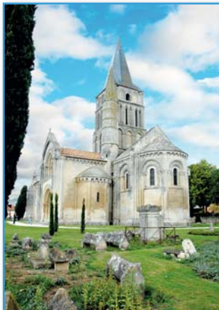
Saint-Pierre d'Aulnay en Saintonge

Une étude de cas, dédiée à l' église Saint-Pierre d'Aulnay , joyau énigmatique à la frontière de la Saintonge et du Poitou, souvent considéré comme une sorte d'apogée de l'art roman en Aquitaine. Cette dernière conférence permettra d'évoquer un des ensembles sculptés romans les plus remarquables en Europe