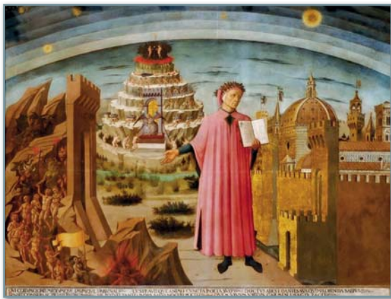
Dante par Domenico Michelino

Tarif adhérent : Forfait à 24€ pour ce cycle de 3 conférences.