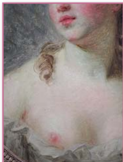
Elisabeth Vigée Lebrun Portrait de jeune femme (détail) 1783 huile/toile Musée du Louvre

Peindre la chair, les courbes d'un corps ou les nuances d'une peau : les peintres de l'incarnation comme Caravage, Rubens, Rembrandt, Bonnard ou Soutine font corps avec le médium de la peinture et nous rappellent la force et la fragilité de notre condition.