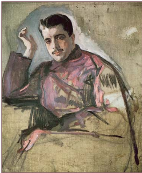
Serge de Diaghilev par Valentin Serov, 1904

Deux femmes mécènes au XXe siècle : la comtesse Greffulhe, la princesse de Polignac