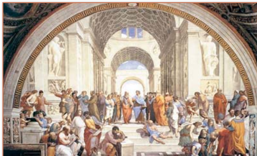
L'École d'Athènes Raphaël chambre de la signature, musée du Vatican

Avec Léonard de Vinci et Michel-Ange, Raphaël incarne le plein accomplissement de la Renaissance en Italie.