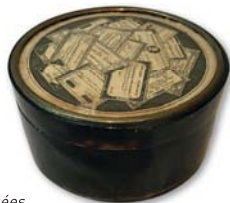
La petite tabatière © Réunion des Musées Métropolitains Rouen Normandie

En adhérant, vous devenez tous mécènes. Merci !